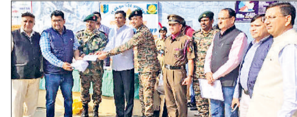
मिवांनी। रक्तदाताओं को सम्मानित करते हुए।