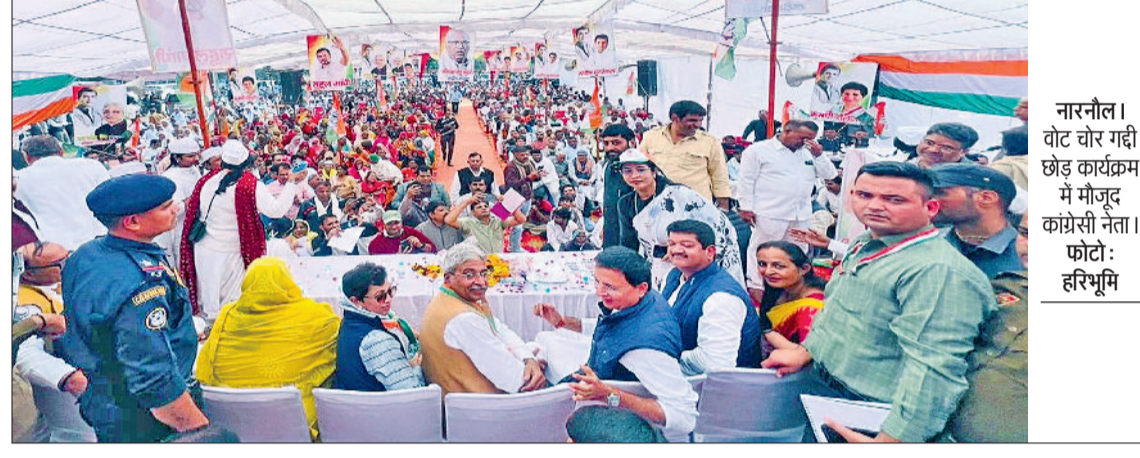
नारनौल। वोट चोर गद्दी छोड़ कार्यक्रम में मौजूद कांग्रेसी नेता।

नामों को मतदाता सूची में शामिल करने जैसे अनैतिक हथकंडों के जरिये 25 लाख वोटों की चोरी की गई। यह लोकतंत्र की खुली हत्या है। उन्होंने कहा कि भाजपा व उसके इशारों पर चलने वाला चुनाव आयोग लोकतंत्र और संविधान पर करारा प्रहार कर रहा है। ऐसे में कांग्रेस कार्यकर्ताओं की जिम्मेदारी है कि वे घर घर जाकर लोगों को जागरूक करें कि हरियाणा में एक अवैध और असंवैधानिक सरकार स्थापित की गई है। प्रदेश अध्यक्ष ने कहा कि किसान आज सबसे अधिक पीड़ित हैं। एमएसपी नहीं मिलती, खाद बीज समय पर उपलब्ध नहीं, जिन किसानों की आय दुबानी करने का वादा किया गया था।