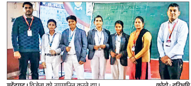
महेंद्रगढ़। विजेता को सम्मानित करते हुए।