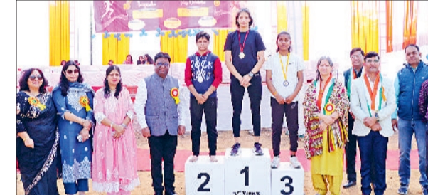
मिवांनी। प्रतिभागियों को सम्मानित करते हुए अतिथि।