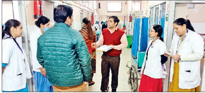
नारनौल। गाथिनी वार्ड में निरीक्षण के दौरान सवाल करते टीम के सदस्य।

सरकार ने इस कार्य के लिए न केवल अस्पताल भवनों के सुधारीकरण के लिए विशेष अभियान चलाया हुआ है, बल्कि अन्य चिकित्सा सुविधाओं को बेहतर करने के लिए विशेष प्रयास किए जा रहे हैं। इसी के तहत पिछले दिनों एनक्वास के मद्देनजर