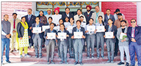
नारनौल। विजेता विद्यार्थियों को सम्मानित करते हुए।