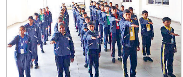
महेंद्रगढ़। शपथ लेते विद्यार्थी।

अस्पताल के अपग्रेडेशन से न केवल महेंद्रगढ़ बल्कि आसपास के ग्रामीण क्षेत्रों के मरीजों को भी बड़ा लाभ मिलेगा। अब लोगों को गुणवत्तापूर्ण उपचार व विशेषज्ञ चिकित्सकों की सेवाएं अपने नजदीक ही प्राप्त होंगी।