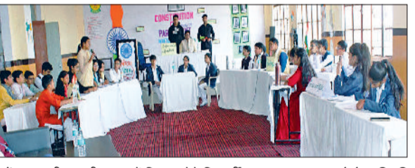
महेंद्रगढ़। शीतकालीन सत्र में हिस्सा लेते विद्यार्थी।