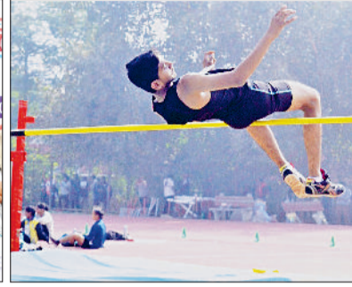
आयोजित प्रतियोगिता में लंबी छलांग लगाता प्रतिभागी, मंचासीन शिक्षा विभाग के अधिकारी तथा ऊंची कूद स्पर्धा में दमखम दिखाता एक प्रतिभागी।