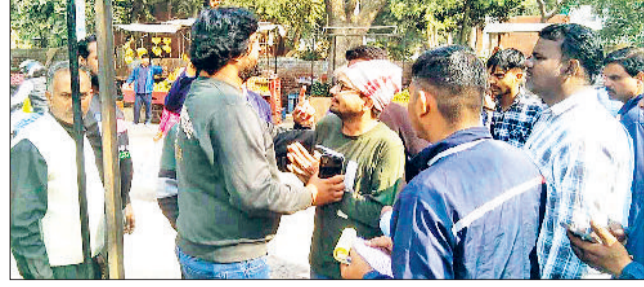
फोटो: हरिभूमि महेंद्रगढ़। चालान नहीं करने को लेकर हाथ जोड़ता रेहड़ी चालक।