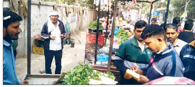
महेंद्रगढ़। रेहड़ी संचालक का चालान करते टीम सदस्य।

रेलवे रोड, आईटीआई रोड, ब्रह्मदेव चौक, आंबेडकर चौक तक अभियान चलाया। इसमें दुकानदारों के बाँस, मेज, प्लेक्स आदि जब्त किए तथा रेहड़ी चालकों के चालान किए गए हैं। नागरिक अस्पताल के पास रेहड़ी चालकों ने टीम के साथ बहस भी की। रेहड़ी चालकों का कहना था कि नगर पालिका की ओर से आए दिन उनके चालान किए जा रहे हैं, पूरे दिन की मेहनत की कमाई वह नगर पालिका को दे रहे हैं। इस दौरान रेहड़ी चालकों ने पक्षपात करने की बात कही। रेहड़ी संचालकों ने चिंता व्यक्त की है कि बाजार से मुख्य अतिक्रमण क्यों नहीं हटाया जा रहा है। दुकानदारों ने पक्का अतिक्रमण किया हुआ है। नगर पालिका की ओर से यह कार्रवाई मुख्य मार्गों और रेहड़ी लगाकर यातायात बाधित करने की लगातार मिल रही शिकायतों पर की गई।