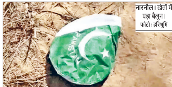
नारनौल। खेतों में पड़ा बैलून।