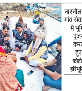
नारनौल। गांव सेका में भूमि पूजन करते हुए।

गिरा। तब से शनि देव यहीं पर स्थापित हैं। यहां शनि देव को तेल चढ़ाने के बाद उनसे गले मिलने की प्रथा भी है, जो भी यहां आता है वह बड़े प्यार से शनि देव से गले मिलकर अपनी तकलीफें उनसे बांटता है। कहा जाता है कि ऐसा करने से शनि उस व्यक्ति की सारी तकलीफें दूर कर देते हैं।